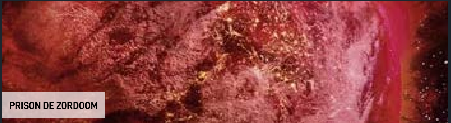
PRISON DE ZORDOOM